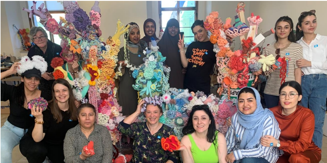
Die Teilnehmerinnen beim Besuch des Korallenriffes im Schlossmuseum.